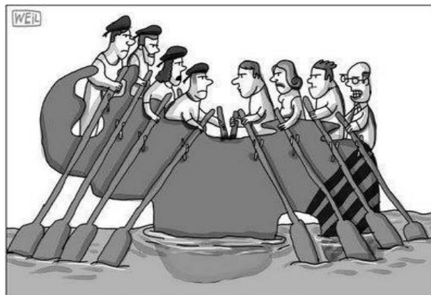
A la derecha o a la izquierda... ¿a dónde vamos?

Esa visión compartida nos ayudará a construir una democracia plural para la convivencia en paz, y a compartir una perspectiva que guíe nuestras acciones hacia objetivos comunes de desarrollo, justicia social y libertades.